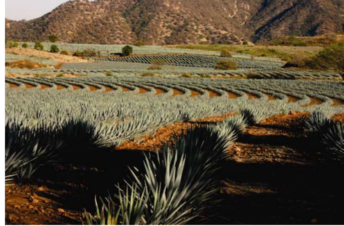
Plantación de Agave

Planta de la familia de las agaváceas, de hojas largas y fibrosas, de forma lanceolada, de color verde azulado, cuya parte aprovechable para la elaboración de tequila es la piña o cabeza. La única especie admitida para los efectos de esta NOM, es la Tequilana weber , variedad azul, que haya sido cultivada dentro de la zona señalada en la Declaración de Protección de la Denominación de Origen Tequila (DOT).